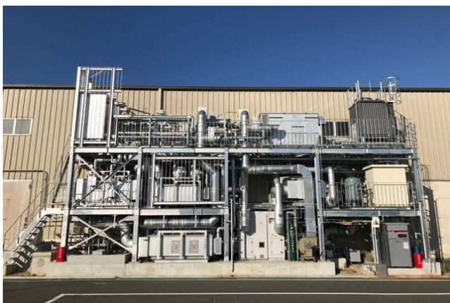
茨城工場「クローズドVOC回収システム」 第48回「環境賞」（主催：国立環境研究所・日刊工業新聞社、後援：環境省）にて「優秀賞」受賞