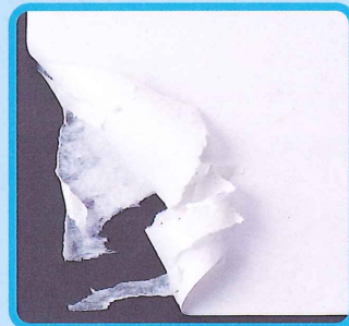
普通の両面テープの場合